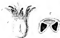
V. crenata. Dr.